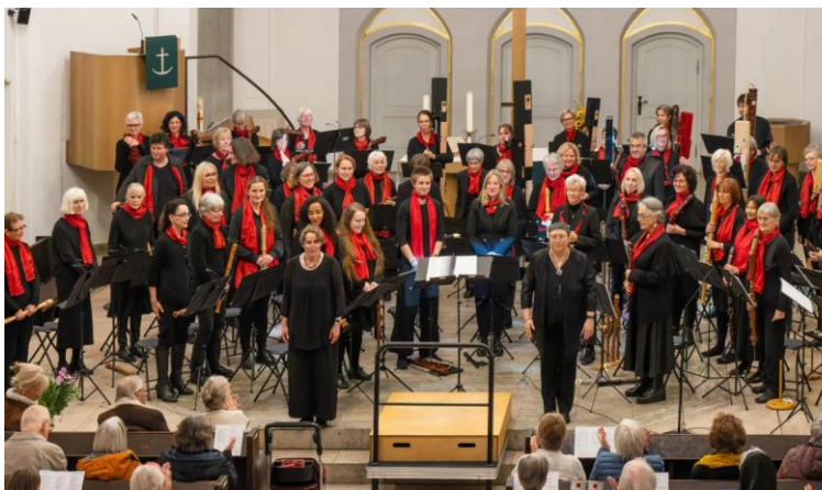
Das BOB bei einem Konzert in der Paulus-Kirche.

Das Blockflötenorchester Berlin (BOB) ist ein Amateur-Ensemble, dem mehr als 50 Spieler*innen angehören. Im BOB kommen Flöten in neun verschiedenen Größen zum Einsatz, vom bleistiftgroßen Sopranino bis zum zweieinhalb Meter langen Subkontrabass. Dabei bilden rund 30 Instrumente die Bassgruppe des Orchesters. So entsteht ein einzigartiger Klang, der gleichzeitig von Sanftheit und orchestraler Fülle geprägt ist. Das Repertoire des BOB ist äußerst vielseitig und umfasst Adaptionen klassischer Werke, Arrangements über Melodien aus dem internationalen Liedgut sowie Originalkompositionen für Blockflötenorchester, darunter zahlreiche Stücke von Irmhild Beutler und Sylvia Corinna Rosin. So zeichnet sich das Blockflötenorchester Berlin durch die Uraufführung dieser Werke aus, die die beiden Dirigentinnen dem Orchester „auf den Leib geschrieben“ haben.